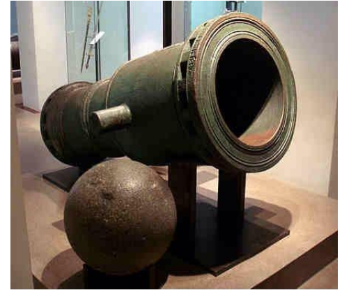
La bombarde est une pièce d'artillerie apparue pendant la guerre de Cent Ans